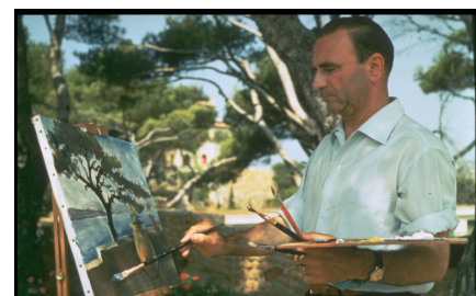
PAUL RICARD. artiste et mécène

Les îles de Bendor et des Embiez (var) célèbrent le centenaire Paul Ricard (9 juillet 1909 – 7 novembre 1997)